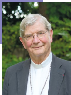
Mgr Laurent Ulrich Archevêque de Paris Président de la Fondation Notre Dame