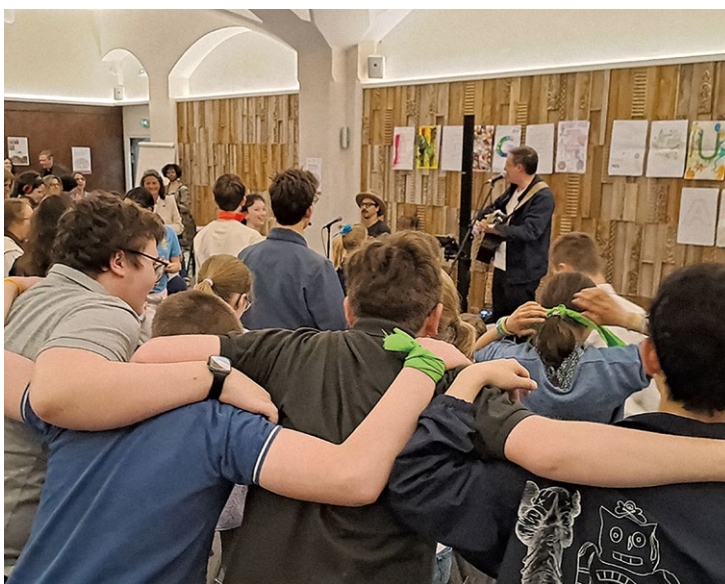
Le Programme Entraide et Éducation a pris en charge l'intégralité de la prestation musicale de la journée, pour un montant de 1 582 euros.

Des temps collectifs de chant, de danse et d'animations ont prolongé ces rencontres dans un esprit festif. En renforçant la cohésion et la confiance en soi, ils ont ancré le message essentiel de la journée : chacun a une place et peut, par son engagement, apporter de l'espérance et du lien social.