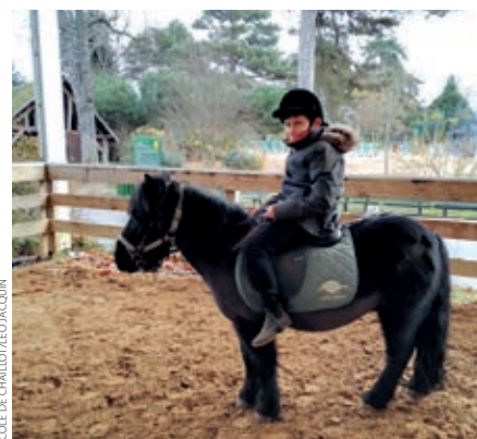
ÉCOLE DE CHAILLOT LÉO JACQUIN

dans son complexe psychosomatique) qu'analytique (mouvements isolés avec précision), favorise une meilleure relation de l'enfant avec son environnement social et affectif. Comme l'énonce un cavalier en herbe, « avec Everest, je me sens calme, il m'apaise », ou encore, « tu crois qu'il me reconnaît, que je lui ai manqué pendant les vacances ? ». L'engouement est réel : « les enfants vont chercher