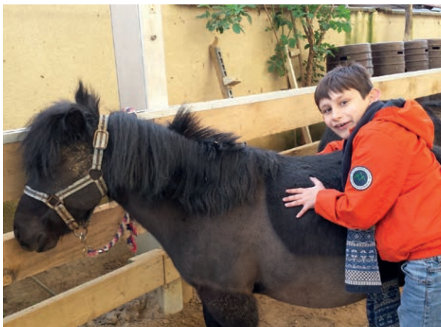
ÉCOLE DE CHAILLOT

Le travail avec le cheval, par son approche tant globale (la personne est considérée