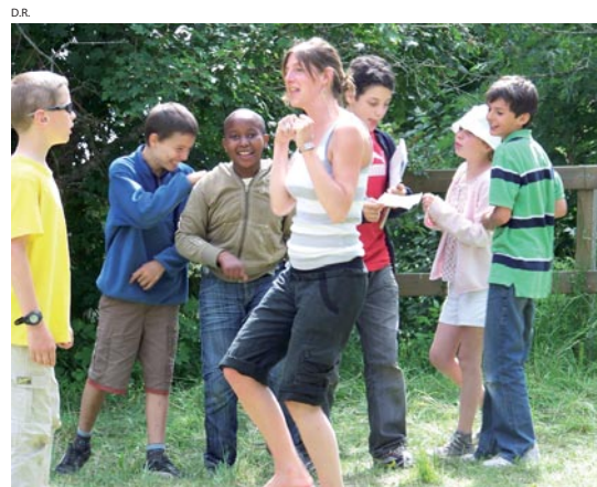
Une solution adaptée aux difficultés d'aujourd'hui : des accueils de loisirs des patronages parisiens.

■ Solidarité et Entraide ■ Culture ■ Education