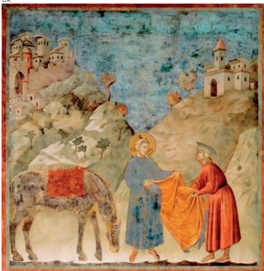
Association Alba Cultura, « Le don du manteau » par Giotto .