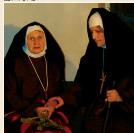
« La vie de Sainte Thérèse » par la troupe du Forum Saint-Denis

pose de rompre avec l'image « cartonnée » de la petite Thérèse. Elle est aussi une belle occasion de renforcer les liens au sein du quartier de Saint-Denis. Le soutien de 6000 euros accordé par la Fondation a couvert 67% des dépenses de ce projet culturel et paroissial. ●