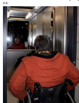
Association Madeleine accessibilité : réalisation d'un ascenseur pour accéder à l'église de la Madeleine.