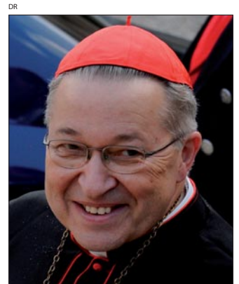
Cardinal André Vingt-Trois Archevêque de Paris Président de la Fondation Notre Dame

Après 18 mois de fonctionnement, 66 personnes en ont bénéficié pour un montant global de 83 600 euros. L'aide apportée a pu varier de 92 à 3 000 euros. Les bénéficiaires sont des personnes en situation de handicap, étrangères ou sans-abris mais aussi des familles défavorisées. Leurs situations manifestent clairement que l'absence d'un réseau familial, quel qu'en soit la cause, accu- sent fortement toute les situations déjà précaires. Ce fonds répond donc à un réel besoin. ●