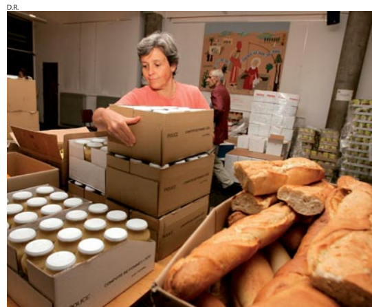
Août Secours Alimentaire : préparation des colis.