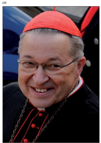
Cardinal André Vingt-Trois Archevêque de Paris Président de la Fondation Notre Dame

Ainsi, il en devient acteur. C'est souvent la condition pour voir une réalisation grandir, s'épanouir et donner du fruit, afin de ne pas se laisser décourager dans sa générosité, mais au contraire de la fortifier et de la renouveler. ●